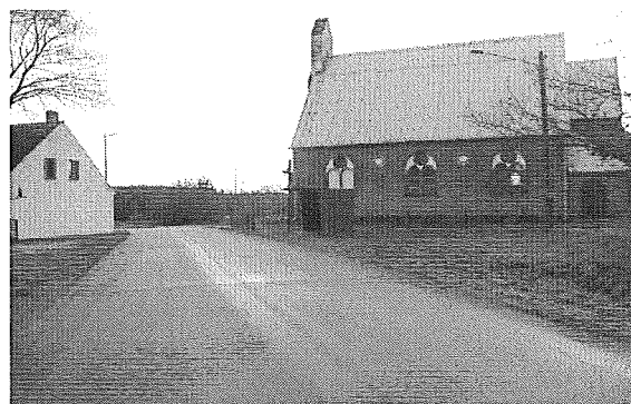
Zdj. Świetlica wiejska w miejscowości Dobrojewo

Remont świetlicy umożliwi powstanie lokalu, w którym będą mogli spotykać się mieszkańcy wsi, przede wszystkim dzieci i młodzież; pozwoli na organizowanie imprez, festynów wiejskich, pobudzi do aktywniejszego uczestnictwa w przedsięwzięciach kulturalnych mieszkańców wsi.