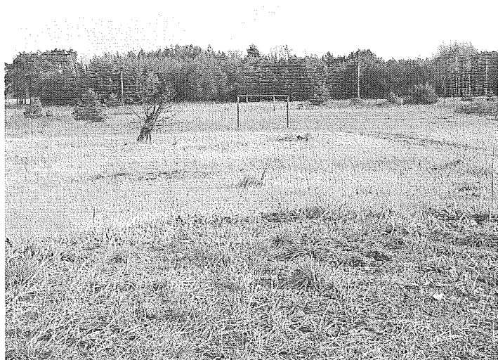
Zdj. Miejsce lokalizacji placu zabaw i boiska sportowego

Projekt : Zagospodarowanie terenu wokół świetlicy na plac zabaw dla najmłodszych mieszkańców wsi